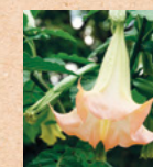
Trombone degli angeli