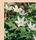
Anemone dei boschi