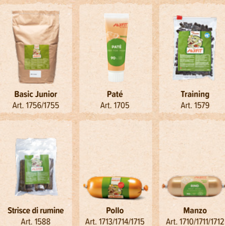
Basic Junior Art. 1756/1755

Per dare un premio ad hoc velocemente, è importante che il bocconcino stia bene in mano e il cane possa ingoiarlo subito, senza masticare a lungo.