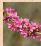
Fior di stecco